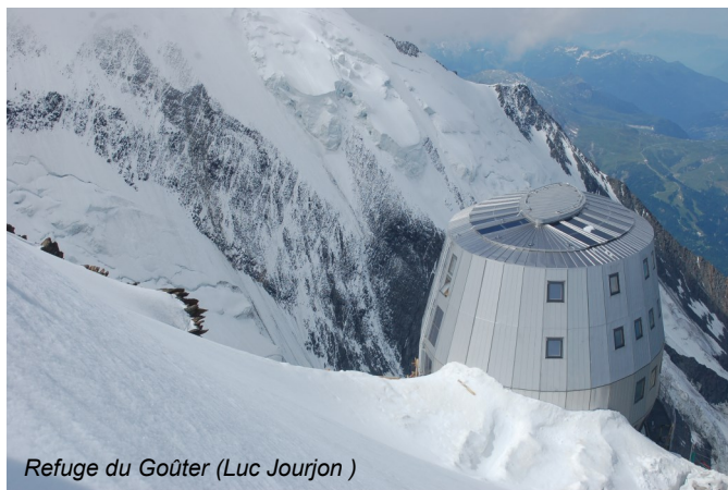
Refuge du Goûter (Luc Jourjon)

Pour l'alimentation en zone non raccordée au réseau, il faut partir des besoins dont l'importance et la cyclicité vont déterminer le mode de production et la capacité de stockage. Ces besoins ne sont pas évalués comme dans la vallée (moins d'eau chaude, température de chauffage plus basse), ils se répartissent en chaleur et électricité : le rayonnement solaire de la journée permet d'accumuler la chaleur sous forme d'eau chaude (capteurs thermiques), tandis que des cellules photovoltaïques stockent l'énergie dans des batteries. L'utilisation de l'énergie éolienne est délicate dans certains endroits à cause du régime des vents, mais peut couvrir néanmoins une partie des besoins de certains refuges ; en moyenne altitude, le recours à des picocentrales peut être avantageux car il permet une alimentation plus régulière.