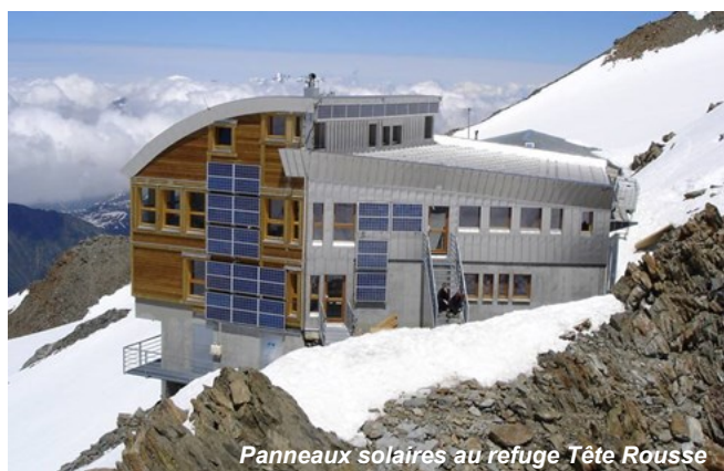
Panneaux solaires au refuge Tête Rousse

La géothermie n'est pas encore suffisamment mûre techniquement pour faire l'objet de recommandations spécifiques à son développement en montagne : si son utilisation à faible profondeur y est plus difficile à cause du froid, la géothermie profonde pourrait, selon l'évolution des techniques utilisées, diminuer à terme la pression exercée par l'utilisation des énergies renouvelables.