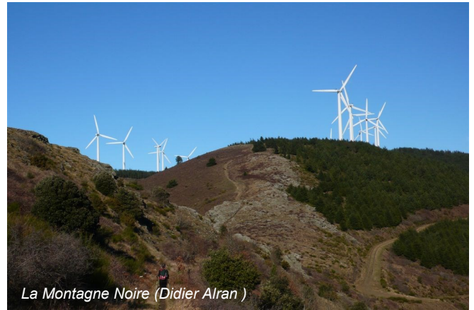
La Montagne Noire (Didier Alran)

Sans compter les dégâts « collatéraux » : atteintes à la biodiversité (bouleversement hydrologique pour les sources, risques pour la faune) nuisances sonores et visuelles pour le voisinage, dévaluation des terrains, détérioration du lien social. Et pour nous cafistes, qui défendons une nature sauvage et l'attrait de randonner sur les crêtes, comment approuver la dénatura-tion de notre environnement ? Comment ne pas craindre l'altération du développement touristique de la région, la présence d'un parc éolien ne pouvant à cet égard qu'être contre-productive ?