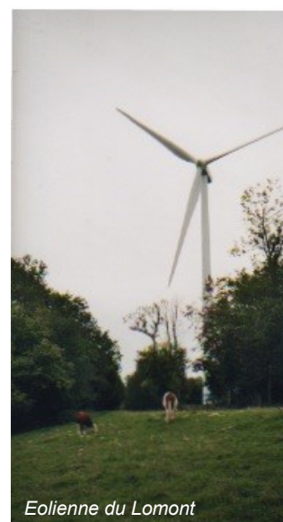
Eolienne du Lomont